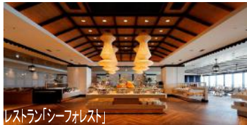
レストラン「シーファレスト」